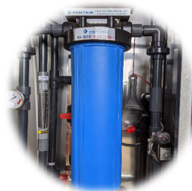
LỌC THÔ BIG BLUE ( Big blue cartridge filter )