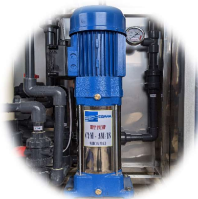
BƠM LỌC CVM - ITALY ( CVM filter pump - Italy )