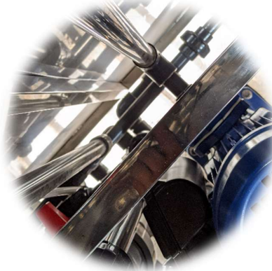
KHUNG VỎ THÉP KHÔNG GỈ ( Stainless steel cabinet )