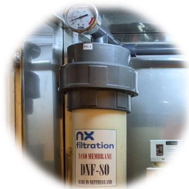
MÀNG LỌC DNF - HÀ LAN ( dNF membrane - Netherlands )