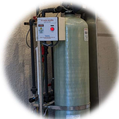
BÌNH LỌC PENTAIR CAO CẤP ( Pentair FRP vessel )