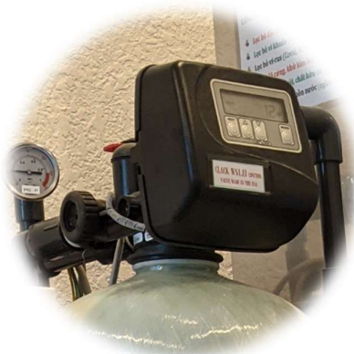
VAN LỌC CLACK WS1.EI - MỸ ( Clack WS1.EI Controller - USA )