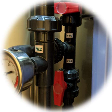
ỐNG VAN U-PVC CAO CẤP ( Hi-class u-PVC piping & valves )